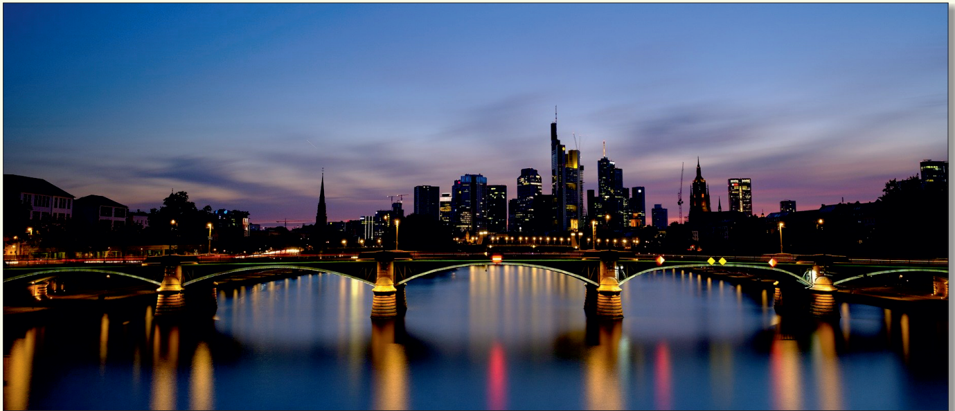
Abendliche Skyline von Frankfurt

3 Tage. Eine Reise in Goethes Geburtsstadt und die heimliche Hauptstadt Hessens.